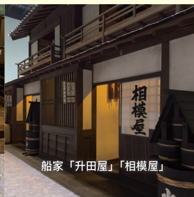
船家「升田屋」「相模屋」