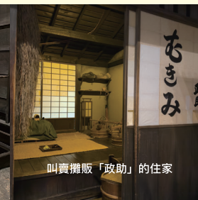
叫賣攤販「政助」的住家