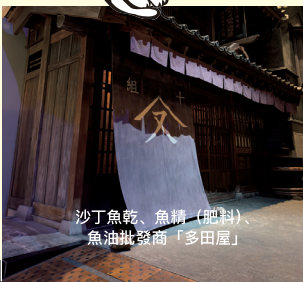
沙丁魚乾、魚精（肥料）、 魚油批發商「多田屋」