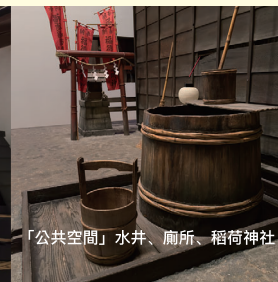
「公共空間」水井、廁所、稻荷神社