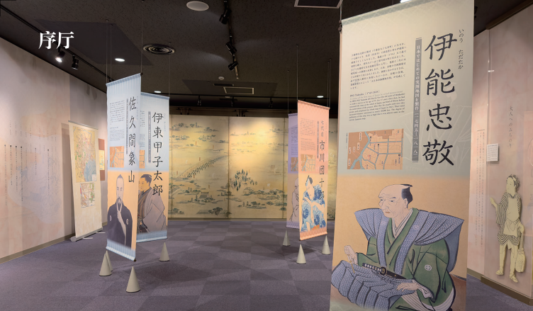
序厅介绍了松平定信、鹤屋南北等与深川有关系的人物和深川的历史。