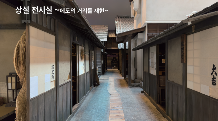
1840년 즈음의 후카가와 사가 마을의 모습을 실물 크기로 재현했습니다. 아침부터 저녁까지 하루의 변화를 음향과 조명으로 연출하고, 계절마다 전시내용도 바꿉니다. 상설 전시에 관한 테마의 전시, 고토구의 장인, 예능에 관한 영상코너가 있습니다.