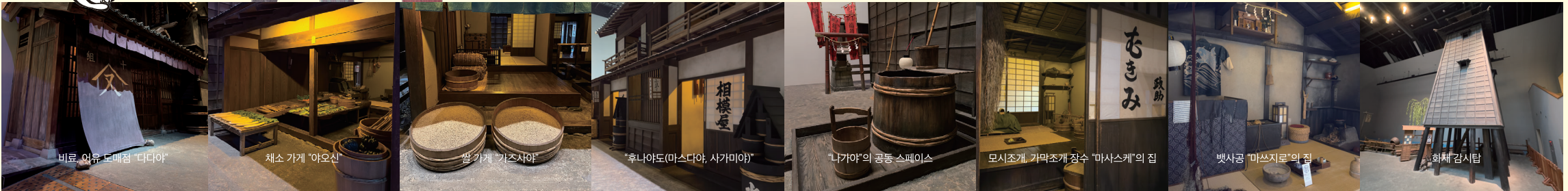
비료, 어유 도매점 "다다야"