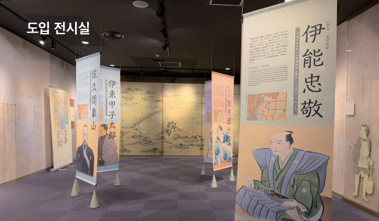
마쓰다이라 사다노부, 쓰루야 난보쿠 등 후카가와와 인연이 있는 사람들과 후카가와와 역사를 소개합니다.