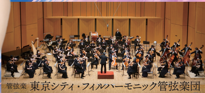
管弦楽 東京シティ・フィルハーモニック管弦楽団

プレ・コンサート 開催！ 開演までの間、東京シティ・フィルハーモニック管弦楽団メンバー によるプレ・コンサートをお楽しみください。14:30 大ホール舞台上にて