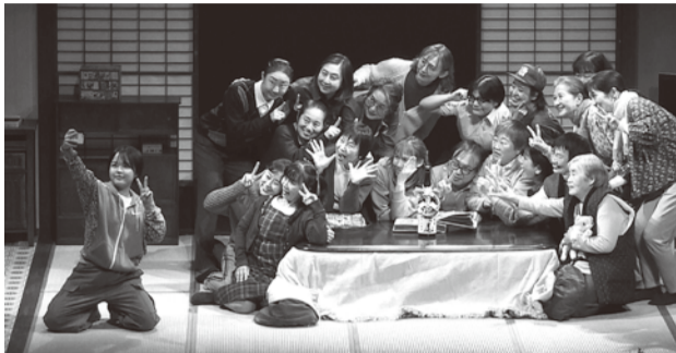
かめいどらぼ 2026 演劇公演「サヨナラ、我が家。」より

2027年2月14日(日)開催 演劇公演「かめいどらぼ2027」の出演者を募集します。劇団青年座の制作・指導により、本公演に向けて演劇ワークショップや稽古を重ね、みなさんと一緒に舞台を創り上げていきます。演劇に興味のある方、舞台上に立ちたい初めての方、大歓迎です! ※同時に「ボランティアスタッフ」を募集します。募集の詳細は7月より各文化センターに設置する募集要項、HPをご覧ください。