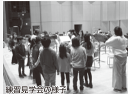
練習見学会の様子

対象:入団希望者と保護者 ※楽器の持参は必要ありません。 当日、直接会場へお越しください。