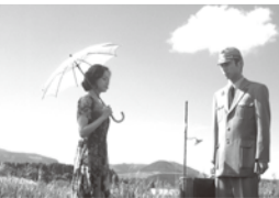
「美しい夏キリシマ」