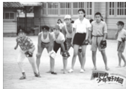
「瀬戸内少年野球団」 製作:YOUの会/ヘラルド・エース